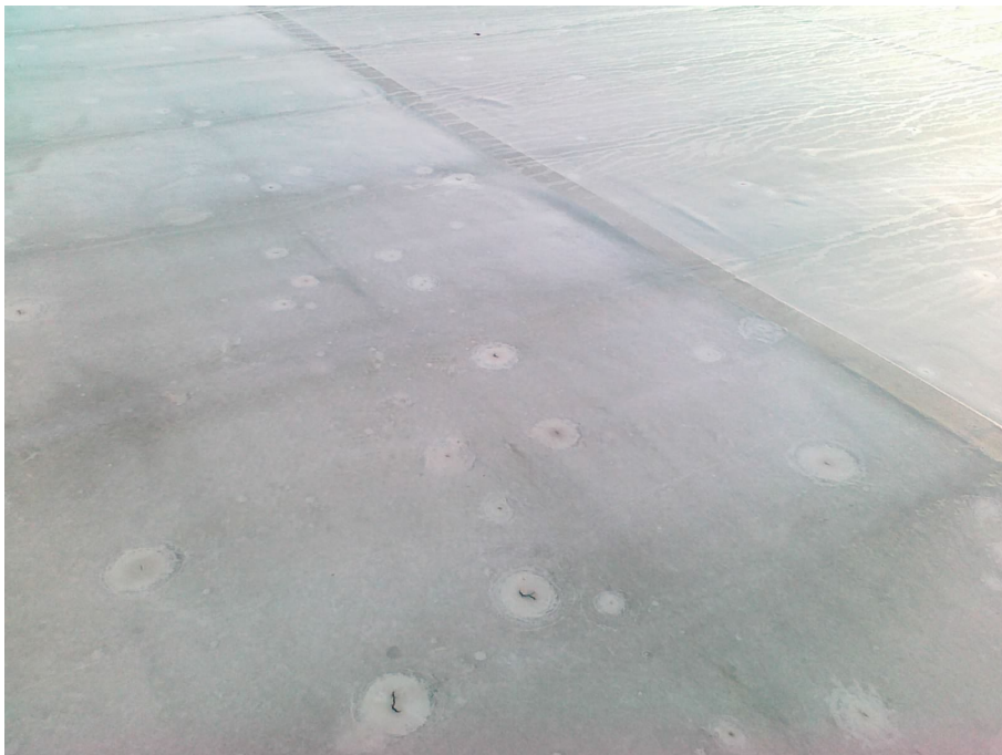
Foto manto copertura