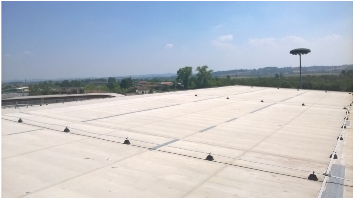
Foto manto copertura