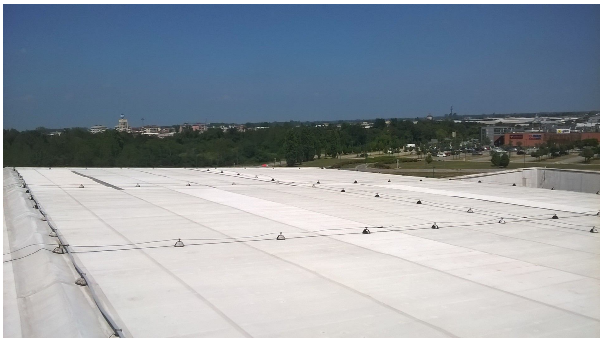
Foto manto cobertura