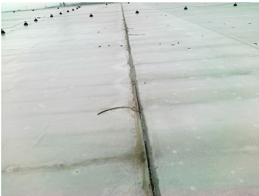
Foto manto cobertura